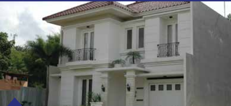
Dinding & Facade Rumah