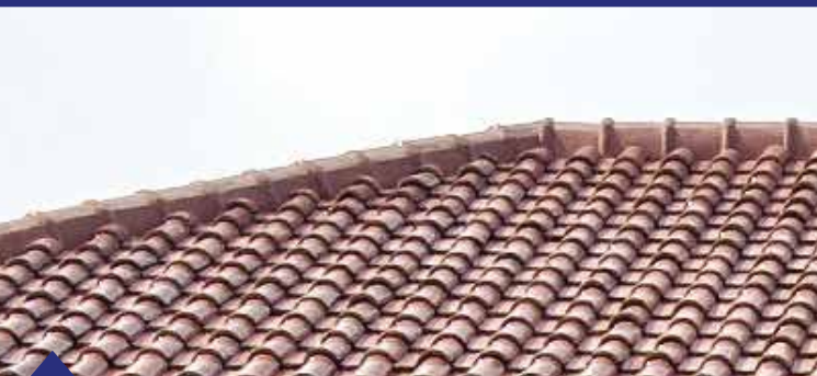
Wuwungan & Atap